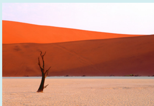
地球上で最も歴史が古いといわれている赤い砂漠 ナミブ (ナミビア共和国)