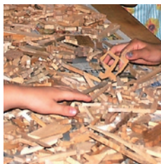
▲色とりどりの木片