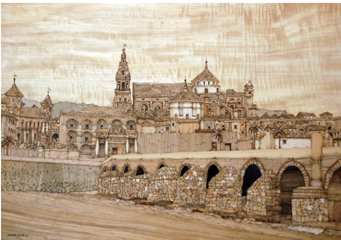
▲《コルドバ ローマ橋から見たメスキータ》星野尚