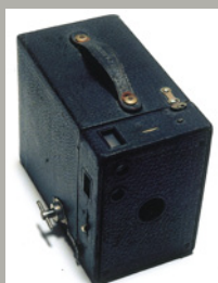
《ライトニングマガジンカメラ》 1899