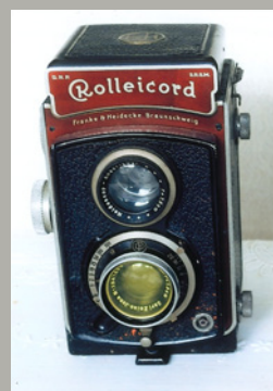
《ローライフレックス・スタンダード》1982