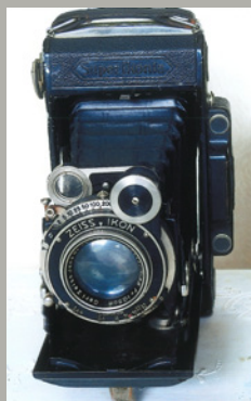
《スーパーセミコンタ》 1934