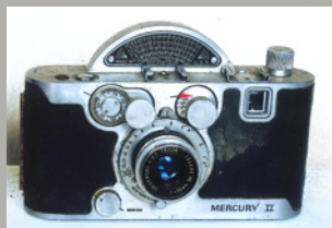
《ローマーキュウリーII型》1942