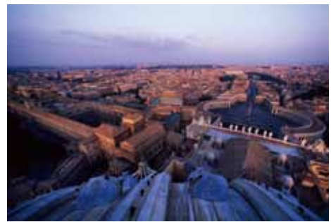
バチカン (バチカン) /野町和嘉