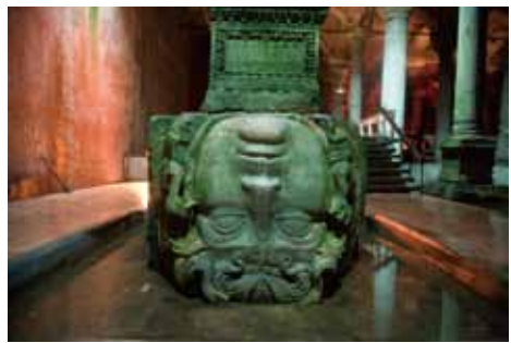
イスタンブール (トルコ) /長倉洋海