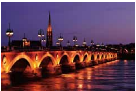
ボルドー (フランス)

ヨーロッパ (20点) イスタンブール歴史地域／イビサ、生物多様性と文化／ボルドー、リュヌマ港／ハンザ同盟都市ヴィスビュー／バチカン市国／アウシュヴィッツ - ビルケナウナチスドイツ強制絶滅収容所／ヴェネツィアとその瀾／フィレンツェ歴史地区／ポルトヴェネーレ、チンクエ・テッレ及び小島群 (パルマリア、ティーノ及びティネット島)