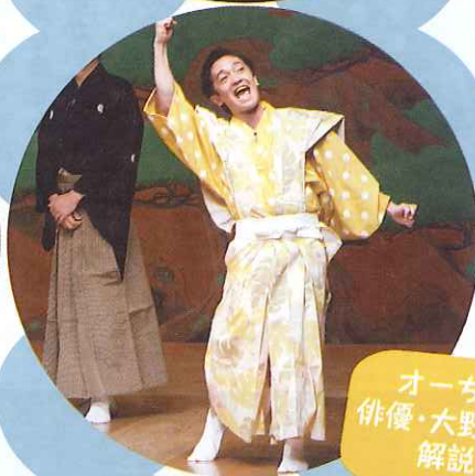
オーちゃんこと俳優・大野泰広による解説あり!