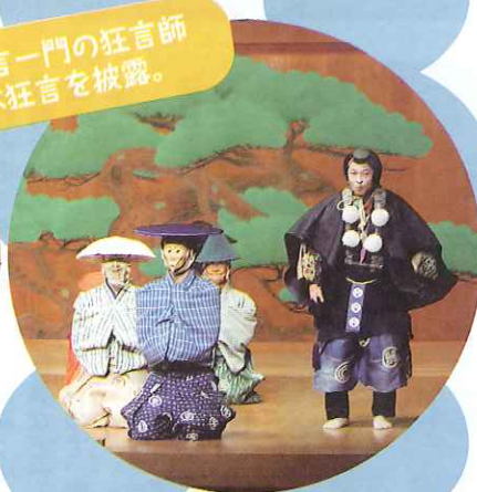
和泉流萬狂言一門の狂言師たちが、本狂言を披露。