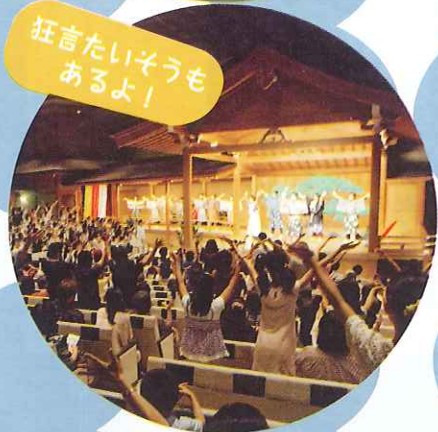
狂言たいそうもあるよ!