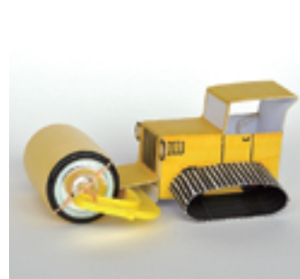
《コロコロドーザー》