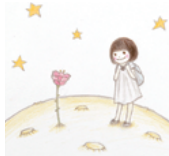
《星の王子様をさがして》